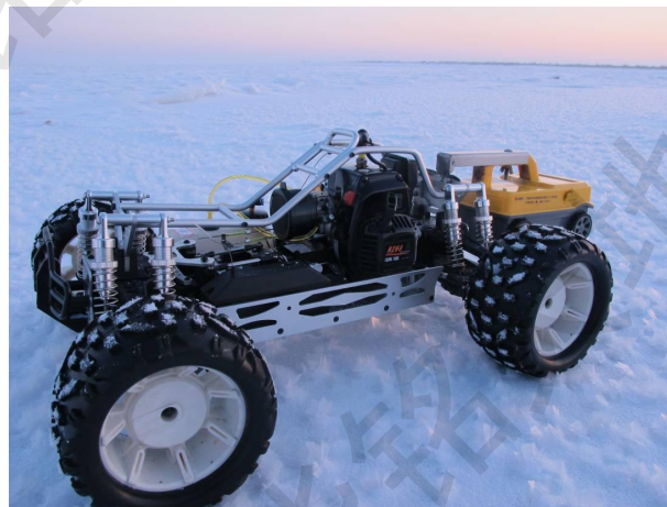
遥控车载探测方式